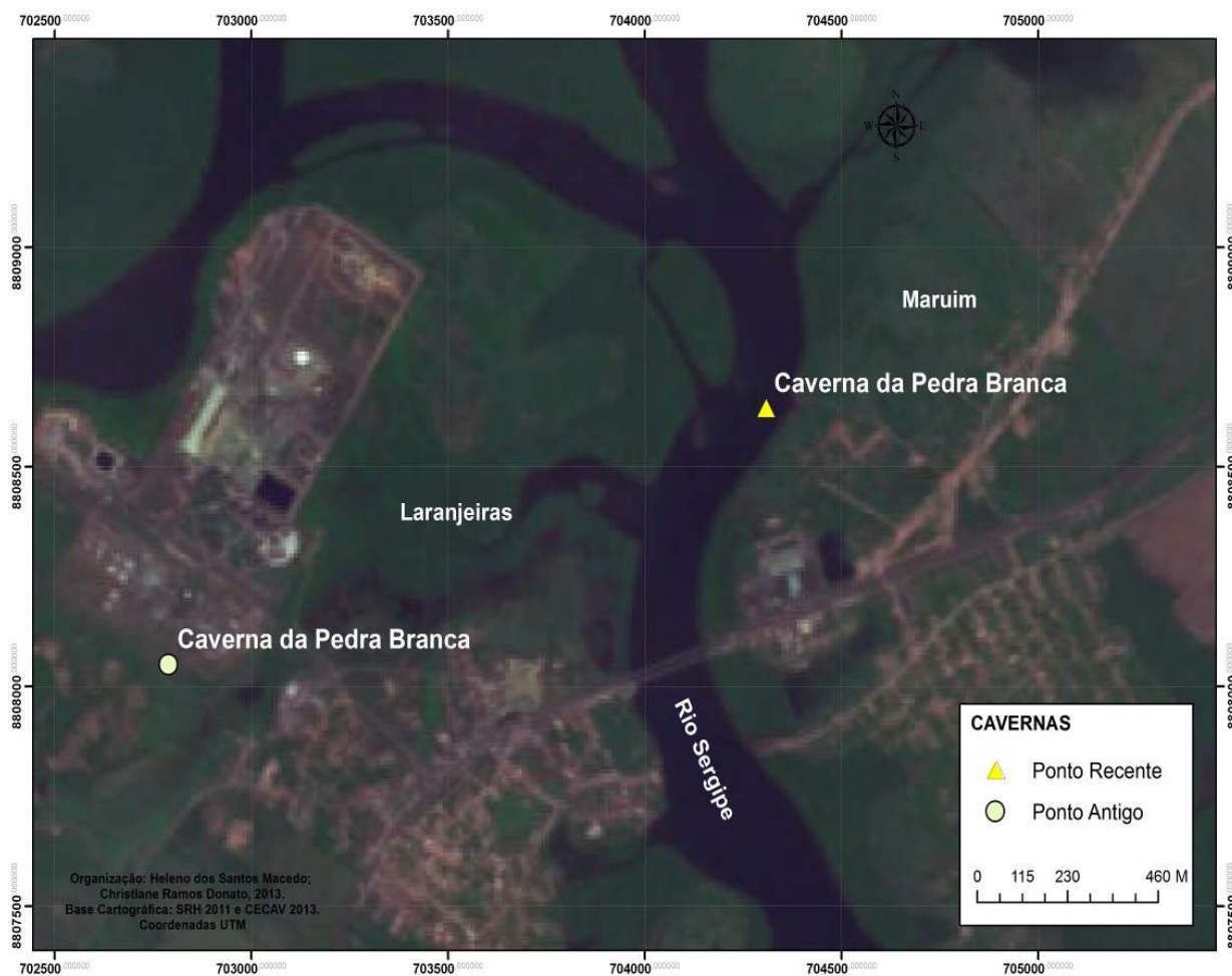
Figura 2 – Carta cartográfica do Município de Maruim com dados de localização antes e depois da validação.