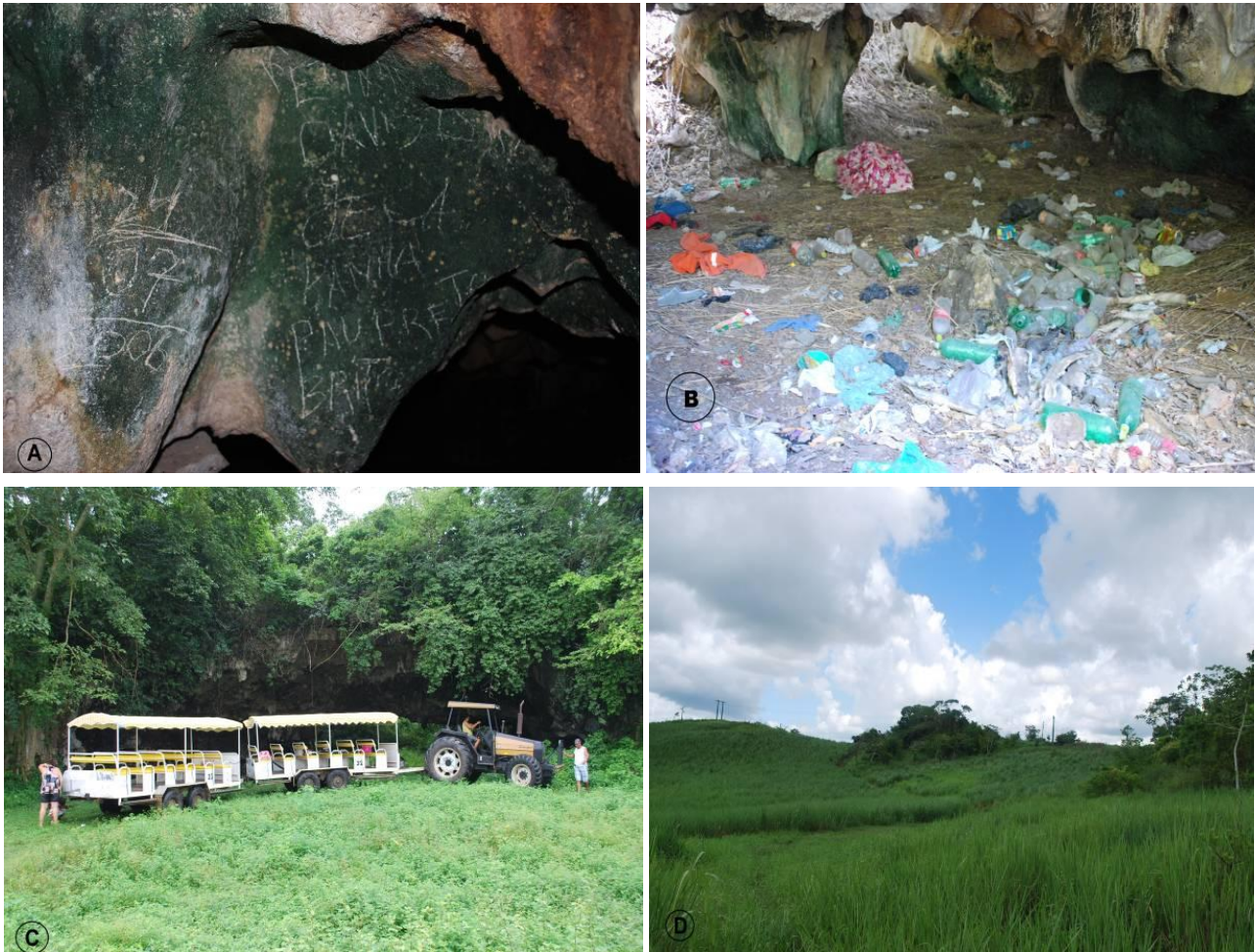
Figura 1. Impactos ambientais causados pelos moradores nas cavernas de Laranjeiras. (A) Pichações nas paredes da Gruta do Tramandaí, (B) Acúmulo de lixo na Gruta do Tramandaí, (C) Turismo desordenado na Gruta da Pedra Furada, (D) Plantação de cana-de-açúcar no entorno da Gruta da Matriana, as espécies arbóreas nativas da Mata Atlântica encontram-se somente ao redor do bloco rochoso.

O DRP mostrou-nos que a comunidade rural sente-se valorizada quando tem a oportunidade de participar como agentes ativos do trabalho de levantamento de dados, e acabam se esforçando para que o trabalho de nós pesquisadores seja desenvolvido de forma satisfatória.