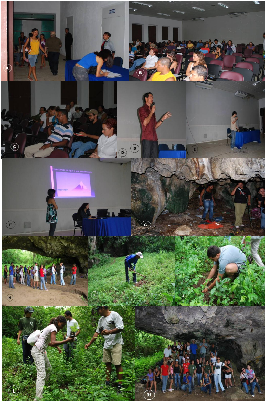
Figura 2. Ciclo de Palestra sobre as Cavernas de Laranjeiras. (A) Recepção dos convidados no auditório da UFS/campus de Laranjeiras, (B) Público inscrito no evento, durante a abertura no auditório (C) Morador do povoado Machado fazendo uma pergunta ao palestrante, (D) Palestra sobre Espeleologia no município de Laranjeiras, (E) Palestra sobre Educação Ambiental com ênfase nos dados coletados com o DRP, (F) Membros do Centro da Terra apresentando uma palestra sobre E.A. e o uso sustentável dos recursos naturais, (G) Moradores e participantes do evento em uma das visitas técnicas na Gruta do Tramandaí, presenciando a degradação da gruta com depósito de lixo, (H) Público do evento reunido na Caverna da Pedra Furada, durante uma oficina de E.A.. (I) Morador do povoado Machado plantando uma muda de espécie nativa de Mata Atlântica nas proximidades da Caverna, (J) e (L) Plantio de mudas de espécies nativas da Mata Atlântica, ação simbólica, mas que foi muito apreciada pelo público e (M) Público que participou das oficinas e visitas técnicas nas atividades práticas durante o evento.